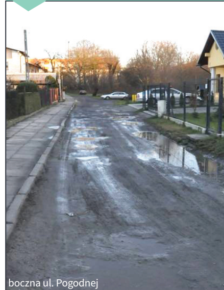
boczna ul. Pogodnej

Ogłoszone przetargi nieograniczone na opracowanie dokumentacji projektowej: