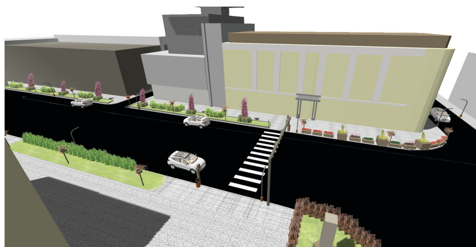
Wizualizacja zagospodarowania zielenią ul. Jana Pawła II