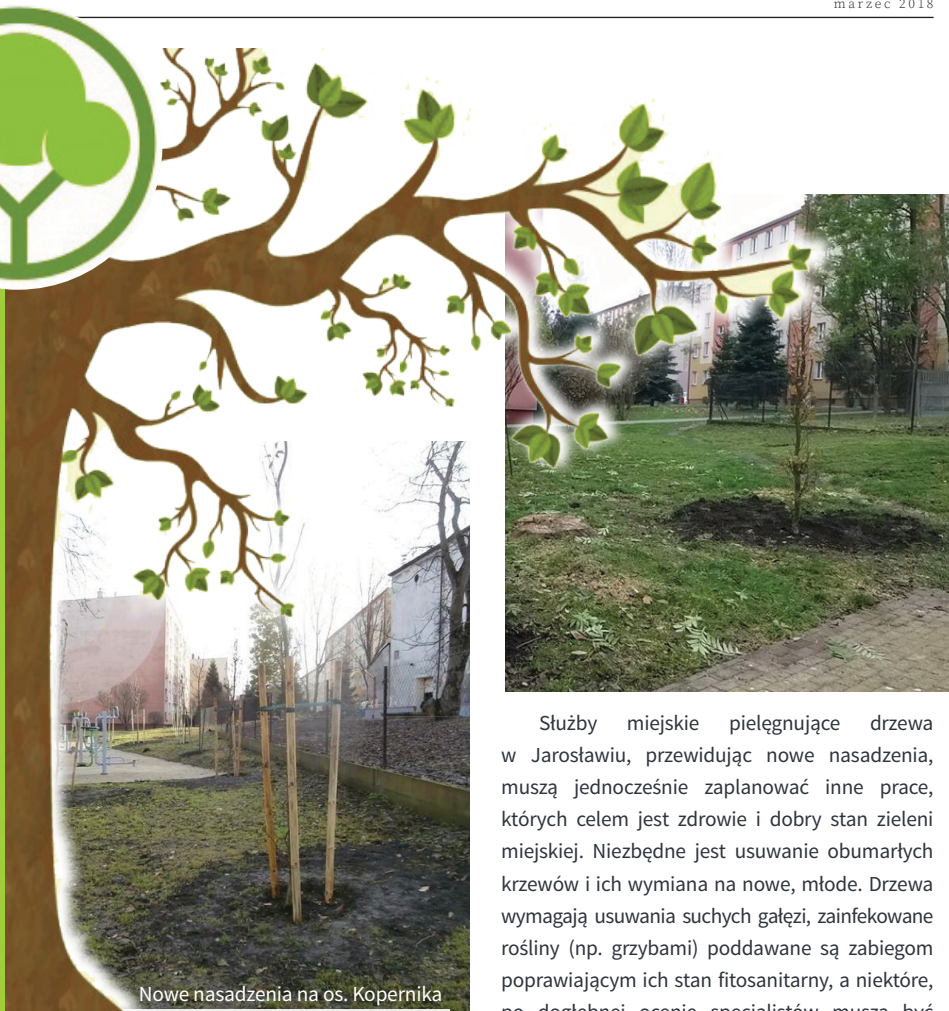
Nowe nasadzenia na os. Kopernika

Stużby miejskie pielęgnujące drzewa w Jarosławiu, przewidując nowe nasadzenia, muszą jednocześnie zaplanować inne prace, których celem jest zdrowie i dobry stan zieleni miejskiej. Niezbędne jest usuwanie obumarłych krzewów i ich wymiana na nowe, młode. Drzewa wymagają usuwania suchych gałęzi, zainfekowane rośliny (np. grzybami) poddawane są zabiegom poprawiającym ich stan fitosanitarny, a niektóre, po dogłębnej ocenie specjalistów muszą być ścięte.