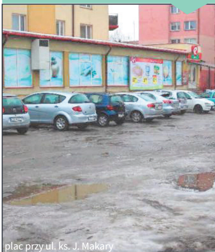
plac przy ul. ks. J. Makary